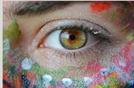
Ein scharfer Blick ist gefragt!

In dem Buchstabensalat sind 23 Begriffe rund um Silvester und den Jahreswechsel versteckt. Sie können waagrecht, senkrecht oder diagonal zu lesen sein, außerdem sowohl vorwärts als auch rückwärts, und sie können sich überschneiden. Die Buchstaben, die übrig bleiben, ergeben einen weiteren Begriff dazu.