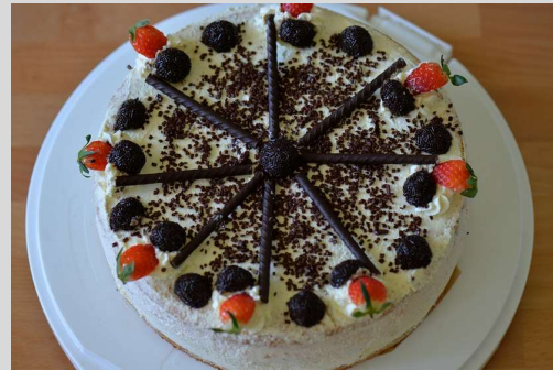
Abb. 1: Eine Leckerei für Knobelfreunde

Rund um des Rätsels Lösung liegen acht „Torten“ = Namen von Arzneimitteln mit jeweils acht „Tortenstückchen“ = Buchstaben. Sechs Buchstaben sind jeweils eingetragen, zwei fehlen. Finden Sie heraus, bei welchem Buchstaben die einzelnen Namen beginnen und welche Buchstaben fehlen. Zu lesen sind sie immer im Uhrzeigersinn.