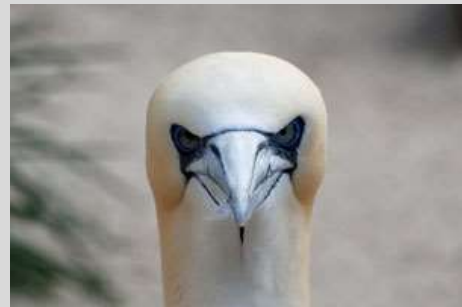
Ein scharfer Blick ist gefragt!

In dem Buchstabensalat sind 18 Begriffe versteckt, die mit dem Repertorisieren(lernen) zu tun haben, incl. des ersten Teils unseres Institutsnamens. Sie können waagrecht, senkrecht oder diagonal zu lesen sein, sowohl vorwärts als auch rückwärts, und sie können sich überschneiden. Die Buchstaben, die übrig bleiben, ergeben den Namen eines bekannten Arzneimittels.